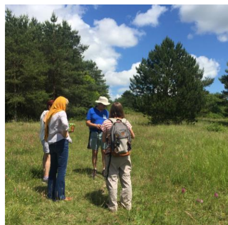
Partout et par tous les temps avec le public : Initiation à la botanique en Forêt d'Abainville – Découverte des papillons à Nançois-sur-Ornain

Au-delà des sorties nature, nous avons également réalisé une exposition de photos d'amphibiens sur les murs du Bistro Doudou de Bar-le-Duc, exposition clôturée par une causerie et une sortie nocturne à la Héronnière de Fains-Véel. Trois stands de conseil et d'information sur la biodiversité ont également été tenus lors d'évènements meusiens et ont attiré une cinquantaine de visiteurs à chaque fois : la 1 re édition de la Journée internationale de la biodiversité à Vassincourt organisée par l'ADAPEI 55, le marché paysan et festif "Sotrés et Potailloux" à Chaillon et la fête du Printemps de Bar-le-Duc .