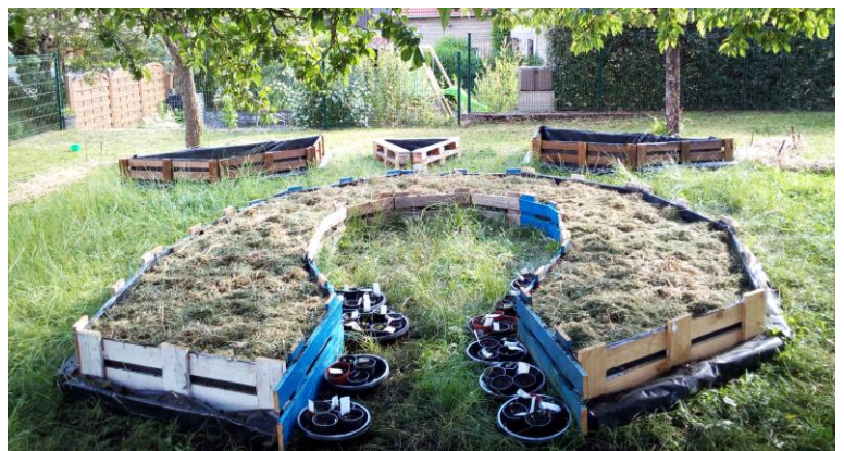
Jardin pédagogique créé par des parents à l'école de Naives-Rosières et support de nos animations

Nous sommes également intervenus auprès de la classe de CE1-CE2 de l'école de Naives-Rosières sur le jardin et l'accueil de la biodiversité. Un jardin partagé initié par des parents d'élèves a été mis en place dans le même temps et a permis de proposer un support pédagogique idéal.