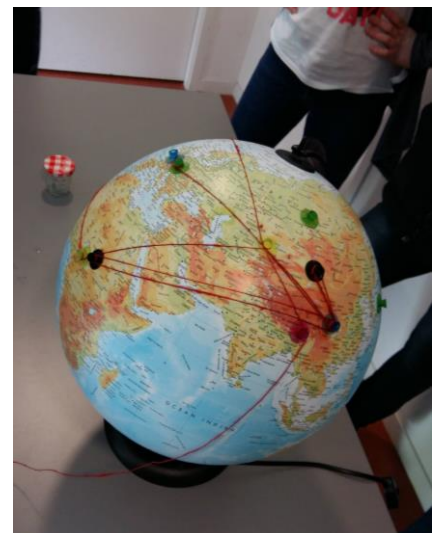
Reconstitution des 4 tours du monde d’un smartphone avec les 4 es du collège de Gondrecourt