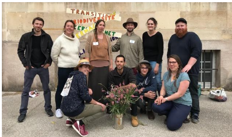
Quelques acteurs du réseau au Marché Bio en mai 2019

Rapidement, nous avons mis en commun des ressources, du matériel, du temps pour construire ensemble des actions communes de sensibilisation. Nous avons mis en place des outils numériques de travail collaboratifs libres (open source). En 2020, il sera temps de nous faire connaître !