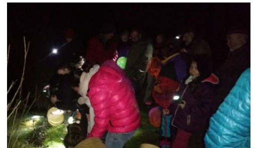
Sortie de découverte des étangs à Trémont-sur-Saulx (mars 2019)