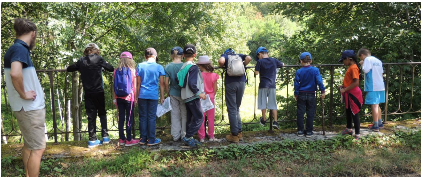
Intervention au centre de loisirs du Bouchon-sur-Saulx (été 2019)

Pendant l'été 2019, notre équipe d'animation est intervenue plusieurs séances auprès d'une dizaine d'enfants de 7 à 8 ans dans le cadre du Centre de loisirs du Bouchon-sur-Saulx . Une belle opportunité pour aborder différents aspects des milieux aquatiques au travers d'approches ludiques et sensorielles : rallye-nature le long de la rivière Saulx, jeux autour de la thématique des traces et indices d'animaux dans une forêt humide, découverte des petites bêtes de l'eau... La protection de l'eau, des zones humides et milieux aquatiques a pu également être mise en lien avec les menaces et les protections concernant les milieux terrestres à travers différentes animations qui ont émaillé la semaine. Les animateurs favorisent la pédagogie active, l'exploration et la découverte guidée.