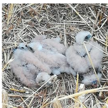
Nid de busards trouvé en vallée de l'Aire (juin 2019)

Grâce aux nombreuses prospections, nous avons observé 73 busards : 65 busards cendrés ( Circus pygargus ), 6 busards de roseaux ( Circus aeruginosus ) et 2 busards Saint-Martin ( Circus cyaneus ). Nous avons repéré 14 nids : 5 à Levoncourt et Gimécourt, : 6 à Dagonville et Ménil-au-Bois et 3 à Villotte-sur-Aire et Ville-devant-Belrain.