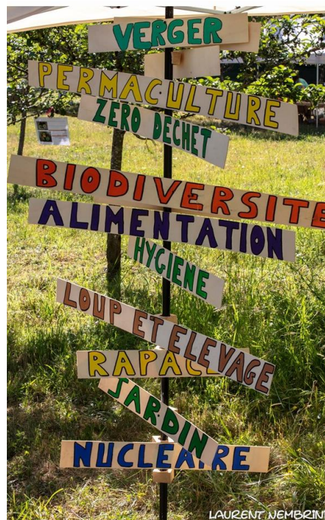
« Totem » du réseau créé par le collectif (mai 2019)

Nous nous sommes formés mutuellement pour monter en compétences en nous enrichissant du savoir et de l'expérience des autres : accompagnement à la mise en place d'un nouveau troc nature en COPARY, soutien au projet émergent de Repair'Café sur le territoire du Barrois, sensibilisation aux impacts du numérique... Nous avons de nombreuses envies pour la suite (voyages d'étude, exposition, film-débat...) et sommes totalement ouverts pour de nouvelles idées !