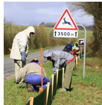
Chantiers d'installation des filets à Reffroy, Bazincourt et Lignièrès-sur-Aire (mars 2019)