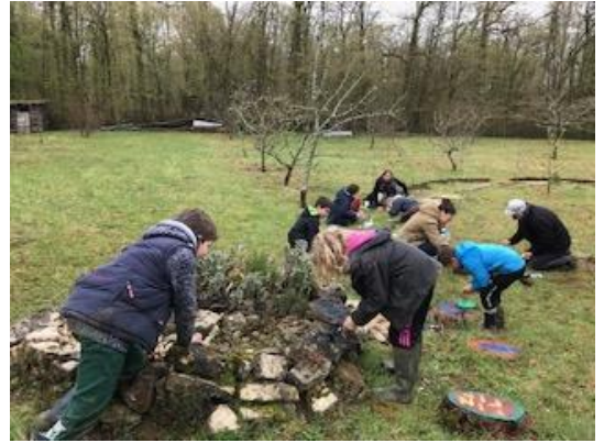
Mini-Mercredi de Massonges (avril 2019)

Chaque premier mercredi de mars à décembre, dans notre jardin-verger pédagogique de Vavincourt. , nous avons renouvelé le club nature « Mini-Mercredis de Massonges ». Le principe de la pédagogie active et de l'animation libre autour de la biodiversité et du jardinage au naturel est toujours apprécié. Il est difficile de mobiliser des enfants dans le temps et des familles sont venues avec des enfants uniquement sur quelques séances. Cinq enfants ont suivi le club régulièrement.